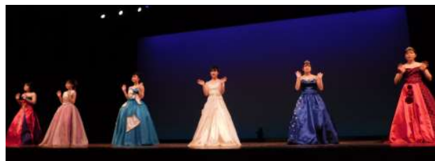
先輩の卒業制作ドレスを着て