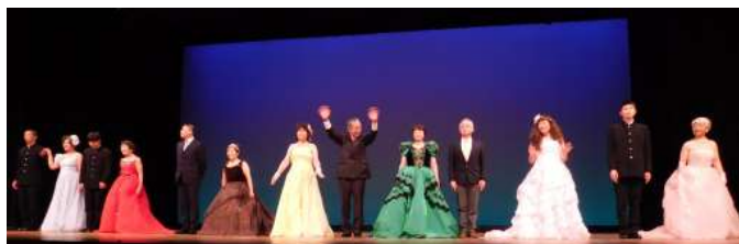
男子生徒がエスコート

しかし、来場してくださった皆さんの笑顔や、一緒に出演した団体の方がとても楽しそうにいきいきとしている姿を見て、本当にうれしくなりました。これからも、私たちの力が地域の活性化に繋がるような活動をしていきたいです。(3年:生活科学科)